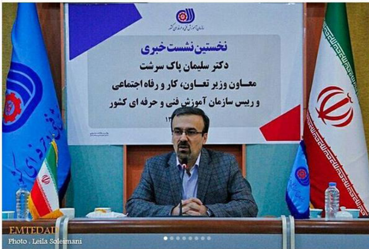
EMTEDIA Photo : Leila Soleimani