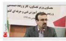
معاون وزیر تعاون، کار و رفاه اجتماعی

معاون وزیر کار خیرباد، سه راهبرد جدید مهارت آموزی را معرفی کرد. این راهبردها شامل: اول، تمرکز بر مهارت‌های دیجیتال و فناوری‌های نوین؛ دوم، تقویت مهارت‌های مدیریتی و رهبری؛ و سوم، توسعه مهارت‌های تخصصی در صنایع مختلف است. وی افزود که این اقدامات در راستای ارتقای سطح اشتغال و بهبود وضعیت اقتصادی کشور انجام می‌گیرد.